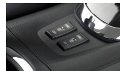
Eluppvärmda säten fram