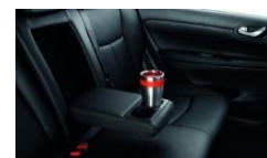
Mugghållare bak (2 st. i armstödet)