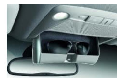
Hållare för solglasögon