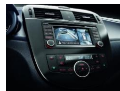
Around View Monitor