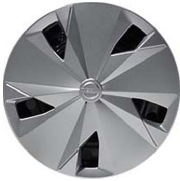
16" stålfälgar med heltäckande navkapslar