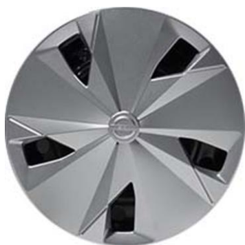
16" stålfälgar med heltäckande navkapslar