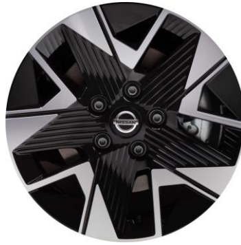
16" lättmetallfälgar, diamond cut