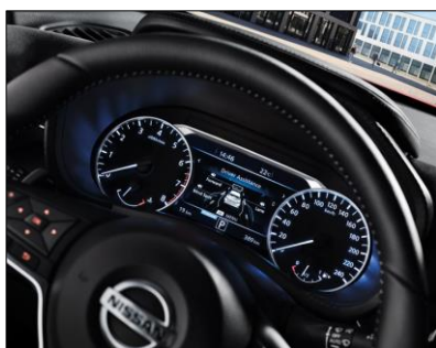
7" Advanced Drive Assist HD-skärm - kombiinstrument