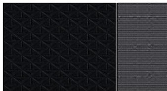
N-CONNECTA Tygklädsel och dekordetaljer, Black