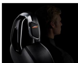
Bose® Personal audio