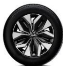
17" fälgar, 2-tone "Sakura"