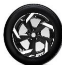
17" lättmetallfälgar Diamond Cut (215/60 R17)