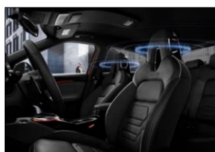
Bose® Personal audio 360