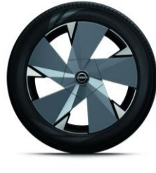
Evolve tillval & Evolve+ 20" lättmetallfälgar