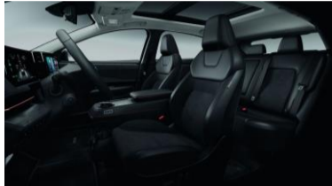
Engage & Advance Kombinerad PVC- / tygklädsel, svart