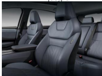
Evolve tillval & Evolve+ Nappa läderklädsel, gråblå