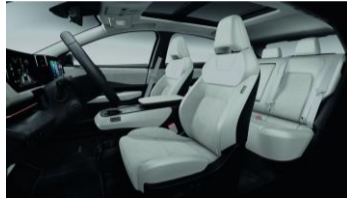
Advance tillval Kombinerad PVC- / tygklädsel, ljusgrå