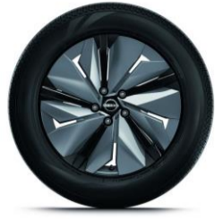
Engage & Advance & Evolve 19" lättmetallfälgar