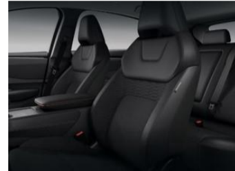
Evolve Kombinerad PVC- / syntetisk mockaklädsel, svart